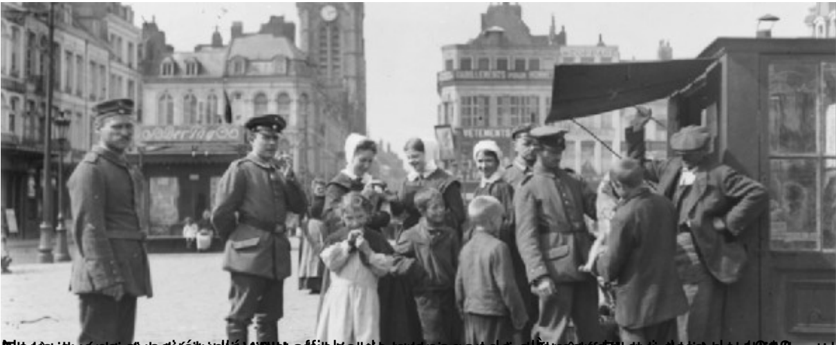
Un soldat allemand en uniforme, un autre avec un drapeau, et des civils, y compris des enfants, dans une rue de Berlin pendant la guerre.

Lundi, 22 Décembre 2014 17:23 - Mis à jour Lundi, 22 Décembre 2014 19:12