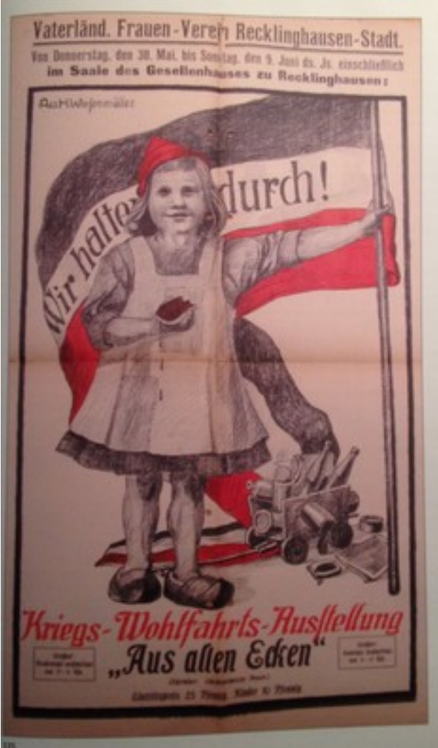
Une affiche de propagande allemande montrant une jeune fille tenant un drapeau et un panier de provisions, symbolisant la résilience et le soutien pendant la guerre.